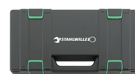
81271013 Cajas de juegos