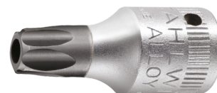
01351008 Punta para destornilladores