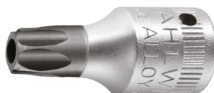
01351009 Punta para destornilladores