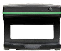
52110220 Bluetoothmodule für Drehmomentschlüssel