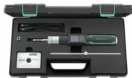
96511730 Giraviti dinamometrici elettromeccanici