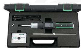
96510700 Giraviti dinamometrici elettromeccanici