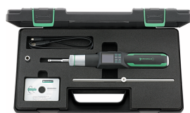
96510712 Giraviti dinamometrici elettromeccanici