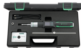
96511700 Giraviti dinamometrici elettromeccanici