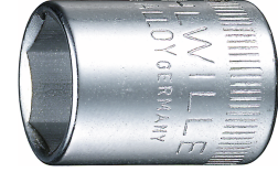
01010014 Douille pour tournevis