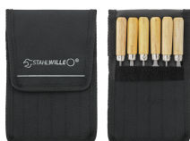
72230001 Jeu de limes à clés