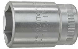
03030017 Douille pour tournevis