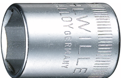
01010005 Douille pour tournevis