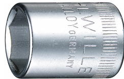
01010008 Douille pour tournevis