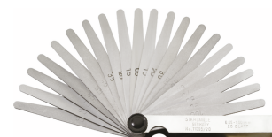
74240002 Jauge d'épaisseur de précision