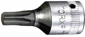
01350027 Douille pour tournevis