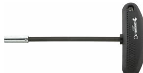
18090016 Tournevis à embout