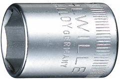
01010013 Douille pour tournevis