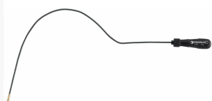
77260027 Levier magnétique