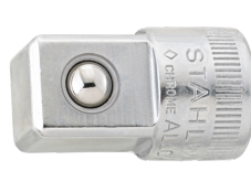
11030003 Douille à choc