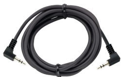
52110051 Cavo con connettore jack