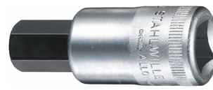
03050012 INHEX- Schraubendrehereinsatz Z