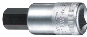
03050014 INHEX- Schraubendrehereinsatz Z