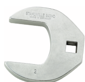
03501076 Llave de pata de gallo, alta resistencia