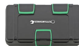
81251019 Skrzynka narzędziowa INHEX