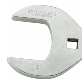
03501069 Kraaienpootsleutel heavy-duty