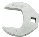
03501072 Kraaienpootsleutel heavy-duty