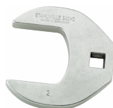
03501076 Kraaienpootsleutel heavy-duty