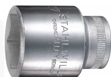
03030019 Wkładka do kluczy nasadowych