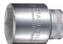
03030027 Wkładka do kluczy nasadowych