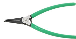
65456102 Pince à circlips pour bagues extérieures