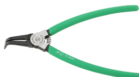
65466121 Pince à circlips p.bagues extérieures