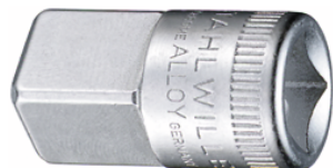
12030003 Douille à choc