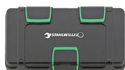
81251019 Skrzynka narzędziowa