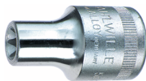
03270010 Inserto chiave a bussola