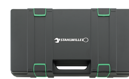
81271019 Cassetta assortimento