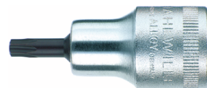
03100027 Bussola a cacciavite