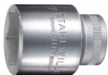
03030019 Inserto chiave a bussola