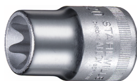
03270020 Inserto chiave a bussola