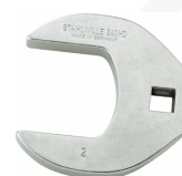
03501069 Clé CROW-FOOT heavy-duty