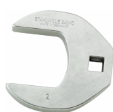
03501064 Llave de pata de gallo, alta resistencia