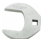
03501076 Llave de pata de gallo, alta resistencia