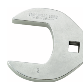
03501069 Llave de pata de gallo, alta resistencia