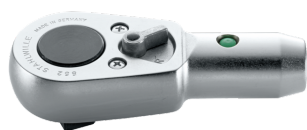
91361318 Cricchetto con impugnatura