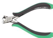
67106000 Alicates de corte diagonal para electrónica