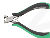
67096000 Cortador de puntas para electrónica