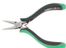
67116000 Alicates planos de punta redonda para electrónica