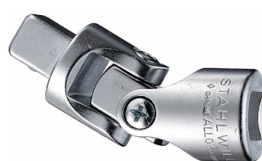
13020000 Przegub cardana