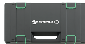
81251014 Cassetta assortimento