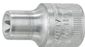
02270008 Inserto chiave a bussola