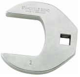
03501074 Kraaienpootsleutel heavy-duty