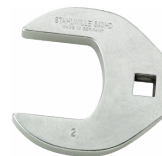
03501072 Kraaienpootsleutel heavy-duty