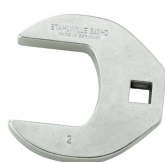
02501032 Llave de pata de gallo, alta resistencia