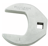
02501056 Llave de pata de gallo, alta resistencia