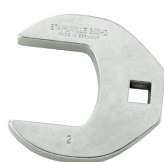
02501028 Llave de pata de gallo, alta resistencia