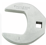
02501036 Llave de pata de gallo, alta resistencia