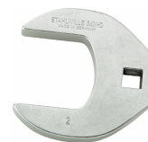
02501042 Llave de pata de gallo, alta resistencia