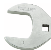
02501062 Llave de pata de gallo, alta resistencia