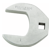
02501052 Llave de pata de gallo, alta resistencia