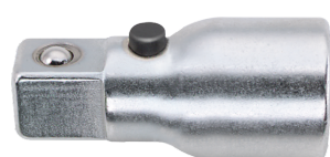
13011001 Prolunga chiave a bussola QuickRelease