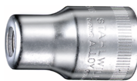
13180010 Uchwyt do bitów