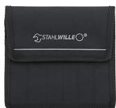
81230057 Borsa per utensili a impatto