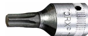
01350009 Nasadka wkrętakowa