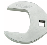
02501062 Crowfoot-Schlüssel heavy-duty