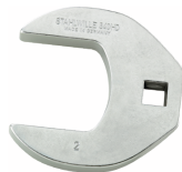
02501042 Crowfoot-Schlüssel heavy-duty