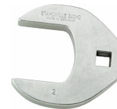
02501038 Crowfoot-Schlüssel heavy-duty