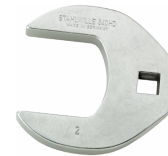
02501028 Crowfoot-Schlüssel heavy-duty