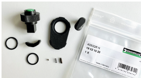
19021020 Knarren-Ersatzteil- Satz