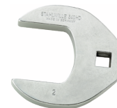
02501050 Crowfoot-Schlüssel heavy-duty