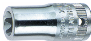
01270008 Inserto chiave a bussola