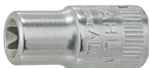
01270005 Inserto chiave a bussola