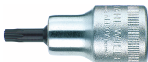
03100027 Bussola a cacciavite