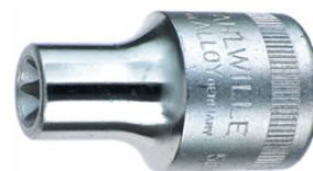
03270010 Inserto chiave a bussola