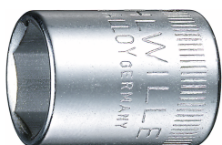
01010008 Inserto chiave a bussola