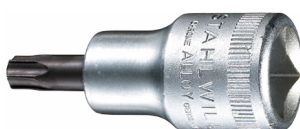
03100045 Bussola a cacciavite