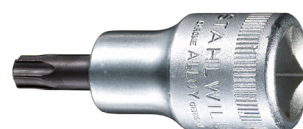
03100060 Bussola a cacciavite