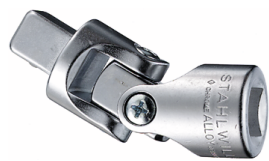
13020000 Joint de cardan