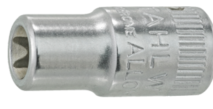
01270007 Douille pour tournevis