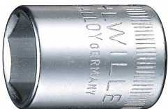
01010008 Douille pour tournevis