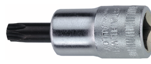
02100027 Schraubendrehereinsatz z