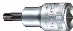
03100050 Schraubendrehereinsatz z