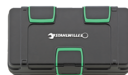
81251019 Cassetta assortimento