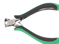
67096000 Szczypce tnące czołowe dla elektroników